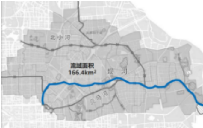
图4-2. 坝河流域面积图